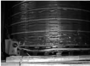
图2 A相中性点附件烧毁情况

在一定程度上绝缘老化,同时,该变压器在历次检修后注油时均未抽真空,造成变压器内部绝缘存在受潮现象,特别A相绕组的中性点部位正对潜油泵的出油管,绝缘受潮更为严重。正常运行时,中性点附近绕组位于低电位,匝间绝缘的设计裕度也很大,所以运行正常。冲击合闸时,变压器励磁涌流很大,铁心严重饱和,绕组分布不均,中性点附近绕组的匝间电压比较高,而该处绝缘因受潮耐压强度下降,最终造成匝间绝缘破坏,绕组烧毁。